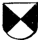
écartelé en sautoir